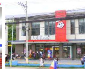
JOLLIBEE The most famous fast food chain in the Philippines