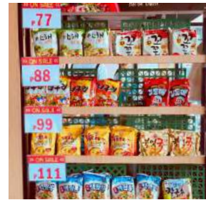
H MART The mart with Korean groceries and Korean food