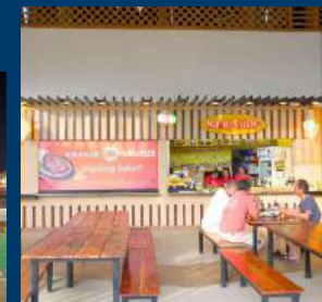
MANANG SAYOUG The restaurant with meat, seafood, fish, chicken, and noodles