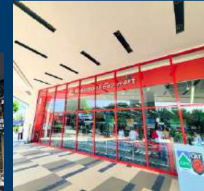
ROBINSONS EASYMART The supermarket where you can purchase various household items and groceries