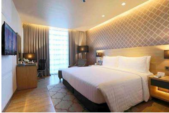
デラックスルーム(1ベッドルーム キングサイズベッド) 約27㎡