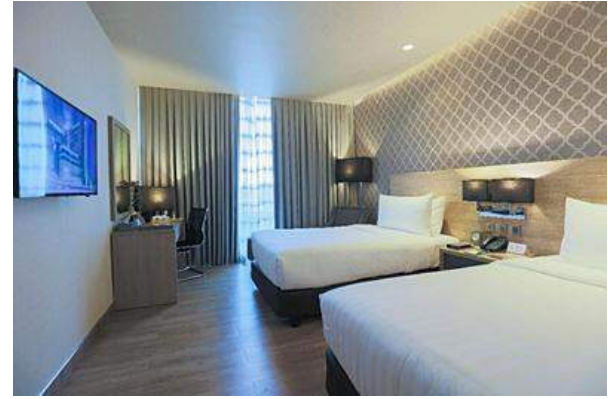
デラックスルーム(2ベッドルーム ダブルサイズベッド)約27㎡