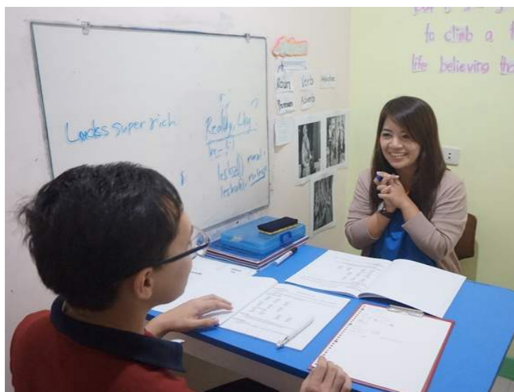
マンツーマンクラス