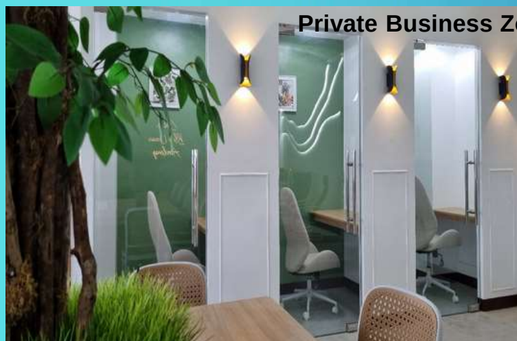
Private Business Zoom Meeting Room