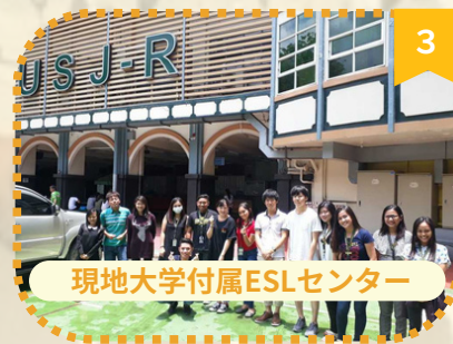
現地大学付属ESLセンター