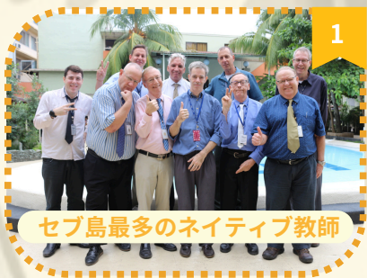
セブ島最多のネイティブ教師