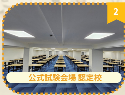
公式試験会場認定校