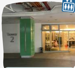
Tower 2 (Basement)