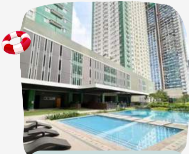
Ground Floor (UG)