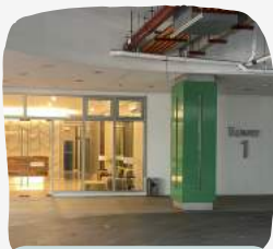
Tower 1 (Basement)