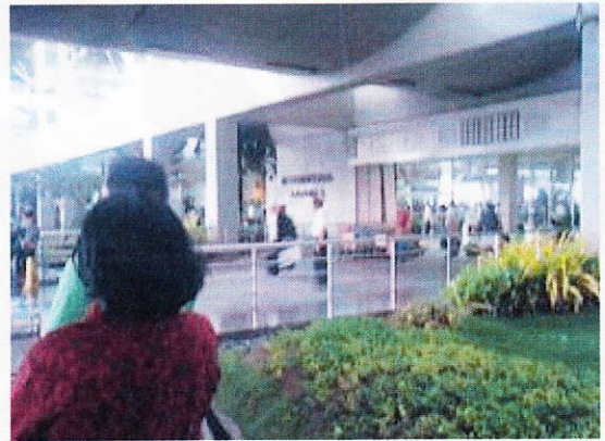
マニラ国際空港ターミナル2 出口

なかなかピックアップのスタッフが見つからなくても、その場を去って自力で学校に向かうことは避けてください。マニラ周辺は交通渋滞が特にひどいので、ピックアップの到着が遅れている可能性もあります。自力でGSに向かう場合の交通費その他費用は返金できません。30~60分探しても見つからない場合は、下記の電話番号に連絡してみてください。