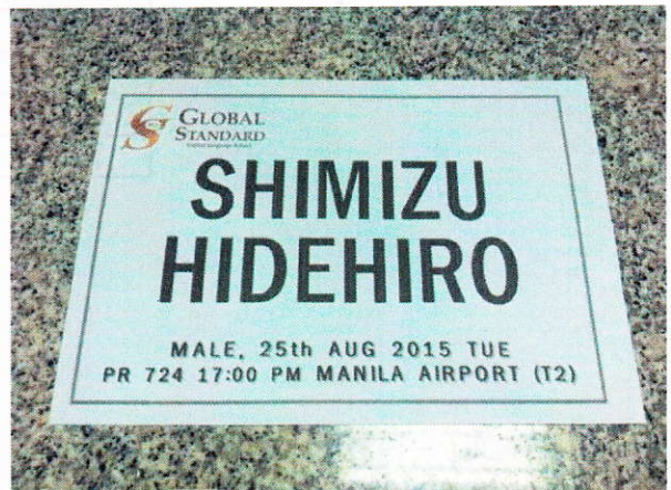
ネームプレート例

※フィリピン・ペソの入手困難な場合は、空港のセキュリティガードにお声かけください。携帯電話を借りることも可能です。使用料金はピックアップ・スタッフと合流後にピックアップ・スタッフに払ってもらってください。