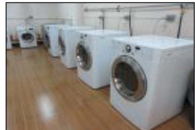
ドラム式洗濯・乾燥機

オーシャンクルーズ → 1階 月, 木 2階 火, 金 3階 水, 土 月～土曜日 9:00～13:00