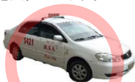
一般的なタクシー 初乗り40ペソ

フィリピンにはジプニー、タクシー、トライシクルなどの公共交通手段があり、基本料金+距離に応じた料金を支払います。学生のみなさんには、タクシーの利用をお勧めします。基本料金は40ペソ(約110円)です。