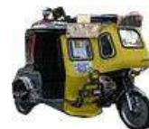
トライシクル 初乗り7ペソ