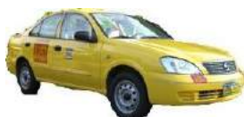
エアポートタクシー 初乗り70ペソ