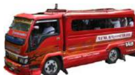
ジプニー 初乗り7ペソ