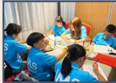
グループクラス (3コマ)