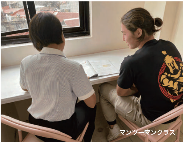
マンツーマンクラス