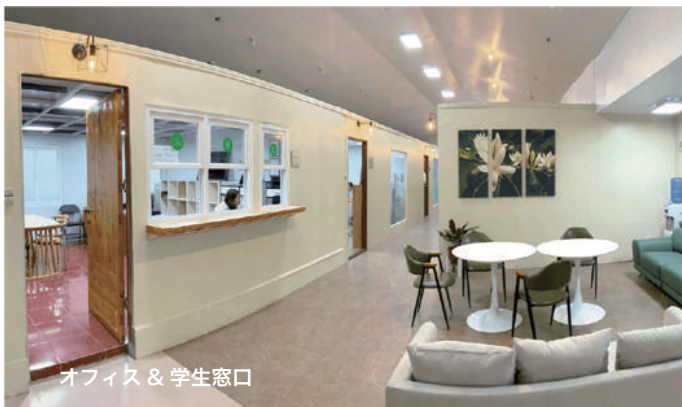
オフィス & 学生窓口