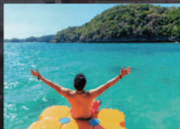
シュノーケリングが楽しめる ハンドレッドアイランド

バギオ市内には遊びの誘惑は少ないですが、周囲にはビーチリゾートや世界遺産など魅力的な観光地がたくさんあります。せっかくの海外留学、週末は仲間と一緒に観光を楽しみましょう。