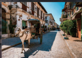
16世紀の街並みが残る世界遺産 ビガン