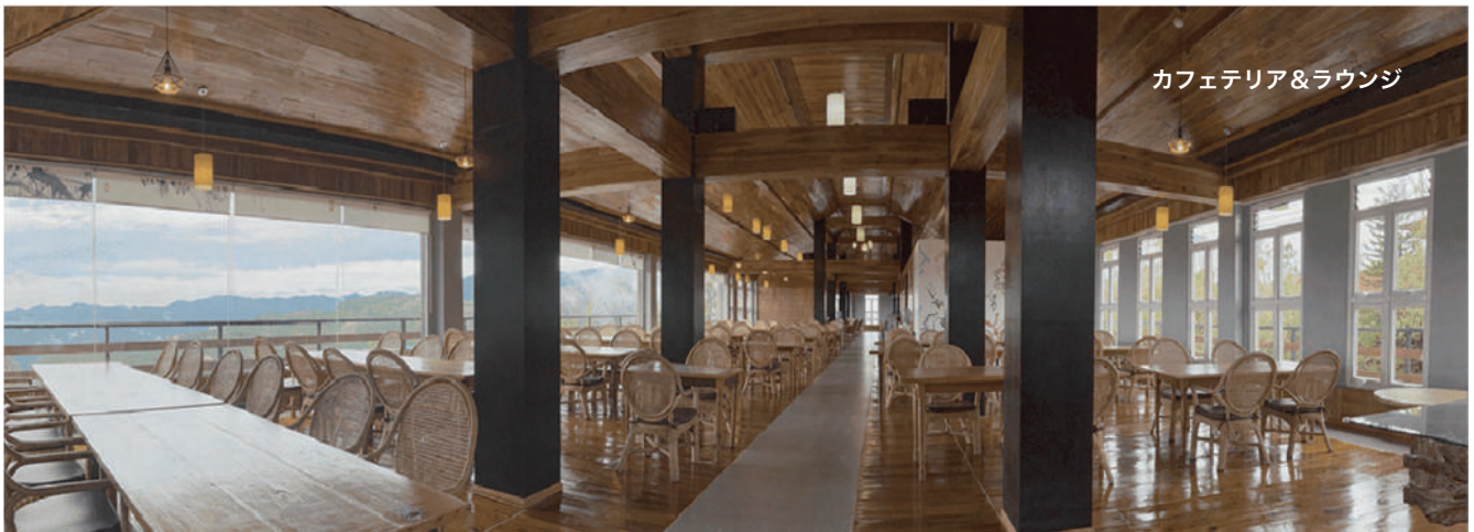
カフェテリア&ラウンジ