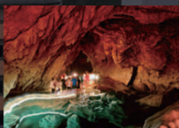
洞窟探検が楽しめる サガダ