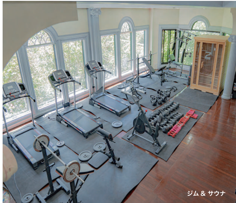
ジム & サウナ