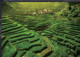
天国への階段の異名を持つ世界遺産 バナウェの棚田