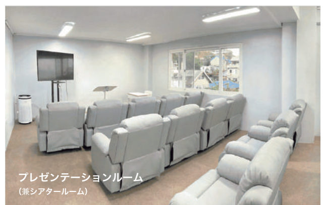
プレゼンテーションルーム (兼シアタールーム)