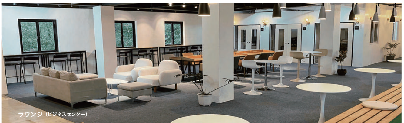
ラウンジ (ビジネスセンター)