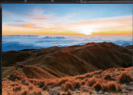
本格的な登山が楽しめる マウント・ブラグ