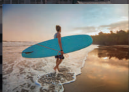
サーフィンが楽しめる サンフェルナンドビーチ