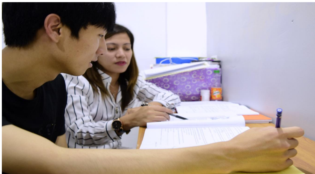
マンツーマンクラス5コマ

祝日・土曜日は特別クラスで、担当講師ではなく代替講師のクラスで受講していただきます。