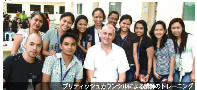
ブリティッシュカウンシルによる講師のトレーニング

SMEAGの講師たちは、ブリティッシュカウンシルの試験官によるIELTSについてのトレーニングを定期的を受けています。ブリティッシュカウンシルのような公的な国際交流機関に所属する試験官から教わることによって、講師の質を格段に向上することに成功しています。