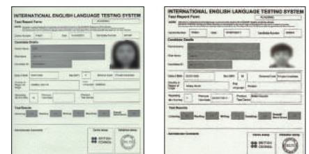
The result of official IELTS test from SMEAG IELTS Course students.