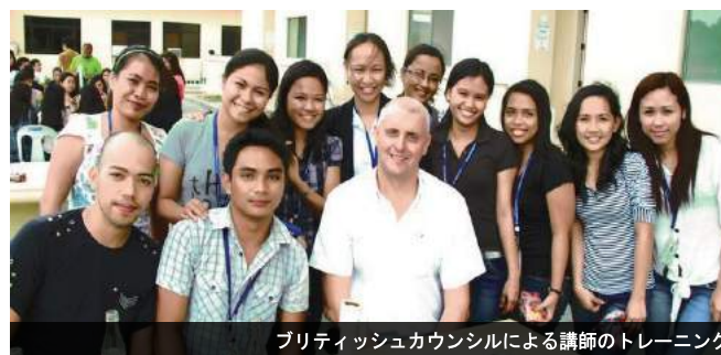
ブリティッシュカウンシルによる講師のトレーニング

SMEAGの講師たちは、ブリティッシュカウンシルの試験官によるIELTSについてのトレーニングを定期的を受けています。ブリティッシュカウンシルのような公的な国際交流機関に所属する試験官から教わることによって、講師の質を格段に向上することに成功しています。