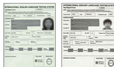
The result of official IELTS test from SMEAG IELTS Course students