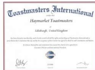
トーストマスター修了証