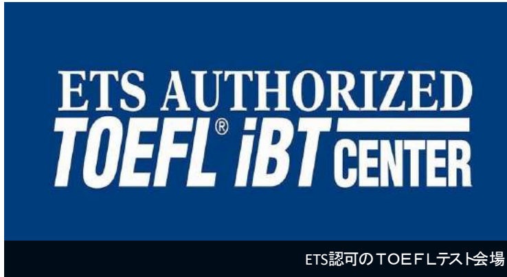
ETS認可のTOEFLテスト会場