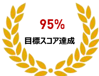
2019年度 保証クラス 卒業生基準