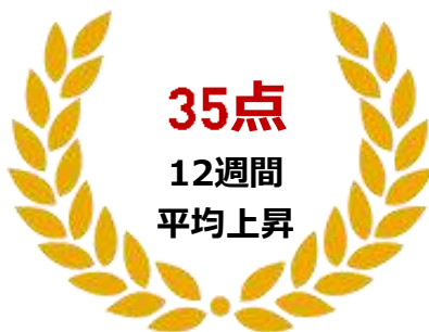
2019年度 受講生 基準