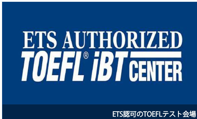
ETS認可のTOEFLテスト会場

SMEAGはETS認定のセブ・フィリピンで初めてのTOEICテスト公式試験会場です。公式試験会場としての認可はETS-Hopkinsからの厳格な審査を通過することによって与えられました。SMEAGの受講生は普段から利用している試験会場（キャピタルキャンパス内）でTOEFLの本試験が受験可能です。