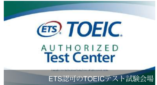
ETS認可のTOEICテスト試験会場