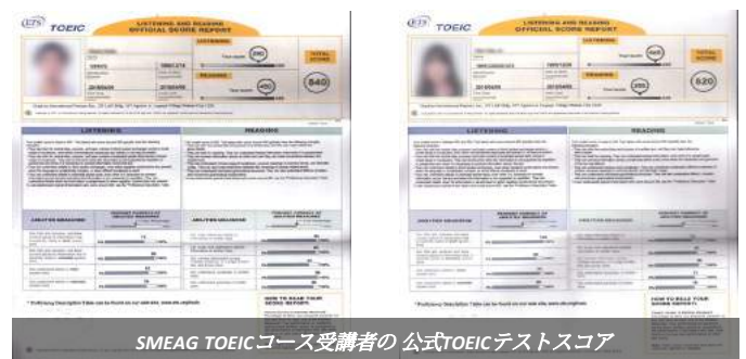
SMEAG TOEICコース受講者の公式TOEICテストスコア