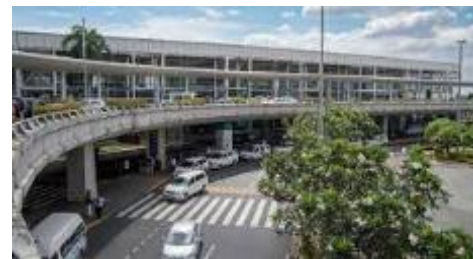
マニラ国際空港（ターミナル2）

コロナ前までもクラーク⇄マニラ北部間は高速道路が開通していたものの、マニラの中心部にあるマニラ国際空港から高速道路間の渋滞がひどく、マニラ⇄クラーク間は2時間～、渋滞状況によっては4時間かかっていました。その後、2020年に『SKYWAY』という高速道路がマニラ国際空港近くからクラーク間全面開通したことで、現在は安定してマニラ空港⇄クラーク間の移動は片道約2時間（最速1時間40分）で可能となっています。