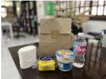
到着時の無料ウェルカムセット