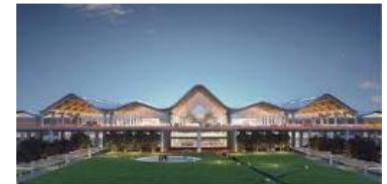
クラーク新国際空港