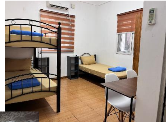
▲3人部屋 ※大きめのベッド1つ+シングル ベッド1つの2種類から選択可