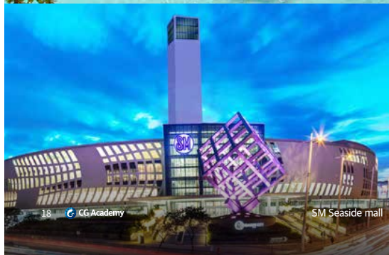
SM Seaside mall