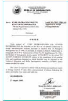
フィリピン移民局SSP