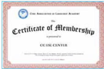
セブ語学院協会会員