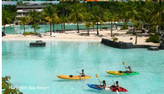
Plantation Bay Resort