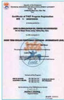
フィリピン教育部TESDA