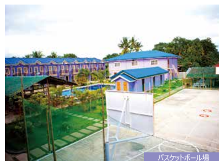
バスケットボール場