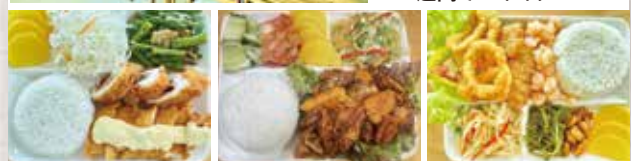
野菜も豊富なメニュー(両キャンパス共通)は7週間で1サイクル!