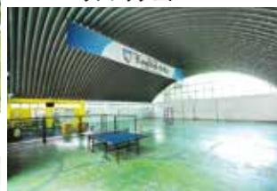
広い体育館 & ジムでリフレッシュ!