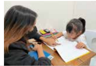
大人気の親子留学