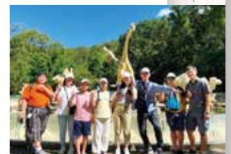
アイランドホッピング等