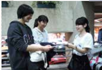
空港ピックアップ