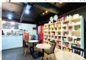
オシャレなカフェは大人気!