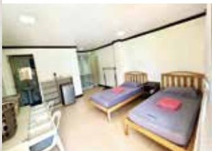
プレミアム個室・2人部屋

プレミアム個室は2人部屋を個室として使用。回線状況は日本よりやや劣りますが各階にWi-Fi有。