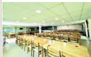
広々とした学食と専属シェフによる全て手作りのお食事