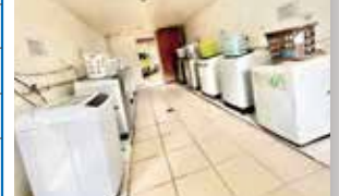
洗濯機利用 & 洗剤共に無料