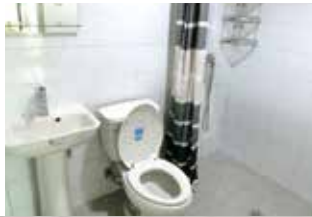
清潔感のあるバスルーム