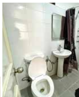
各室内 (個室 B 以外) の バスルーム