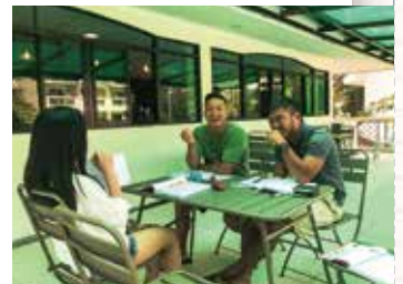
カフェでリラックス