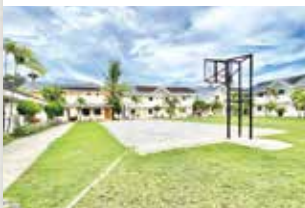
開放感溢れるキャンパス内

開放的な雰囲気です。運動施設が完備され、生徒同士が交流しやすい構造は中長期留学生からも好評。