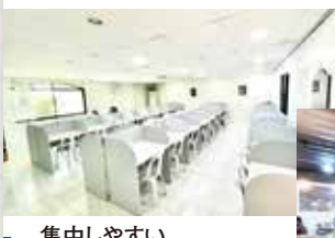
集中しやすい自習室は複数有