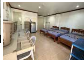
個室 B 共用スペースは 生徒同士交流の場