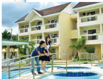
プールブリッジ & 寮外観