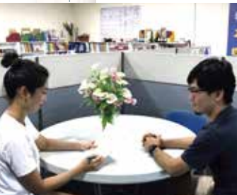
個別カウンセリング