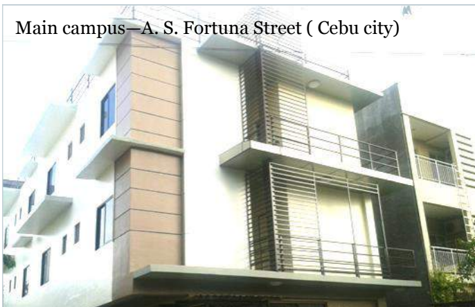
Main campus—A. S. Fortuna Street ( Cebu city)