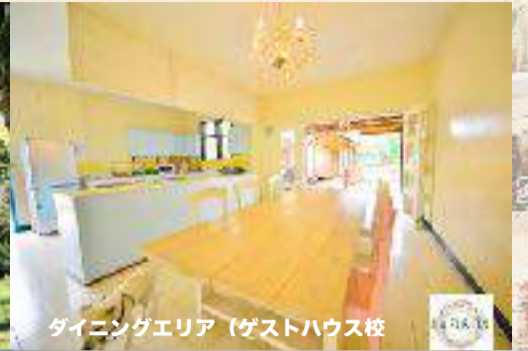
ダイニングエリア (ゲストハウス校)