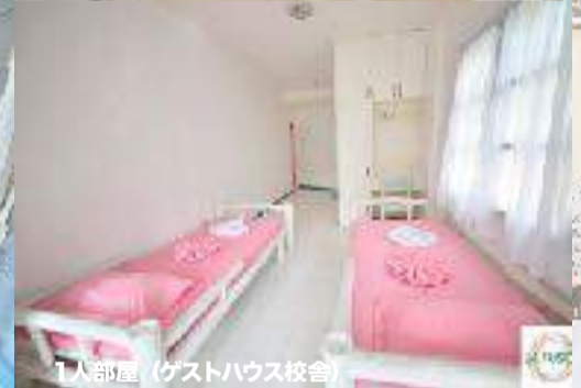
1人部屋 (ゲストハウス校舎)