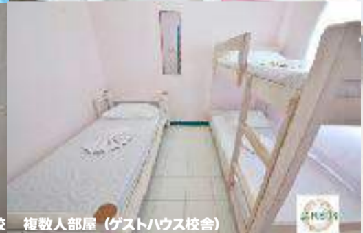
複数人部屋 (ゲストハウス校舎)