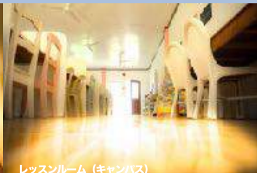
レッスンルーム (キャンパス)