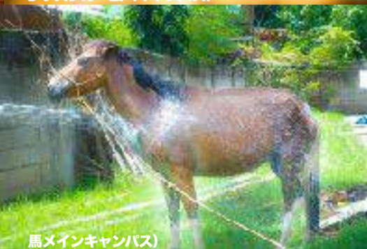
馬メインキャンパス