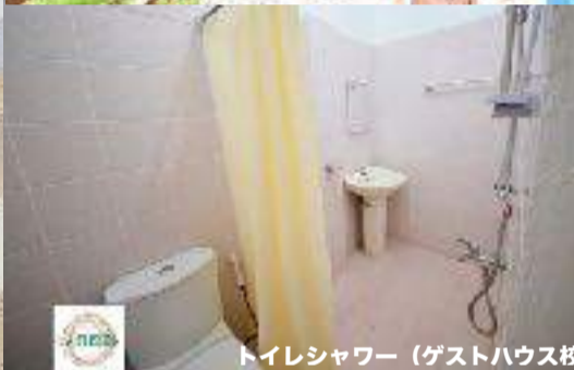
トイレシャワー (ゲストハウス校)