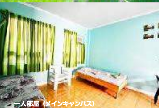
一人部屋 (メインキャンパス)