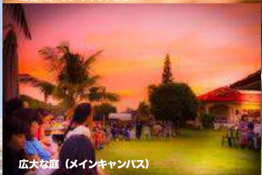
広大な庭 (メインキャンパス)