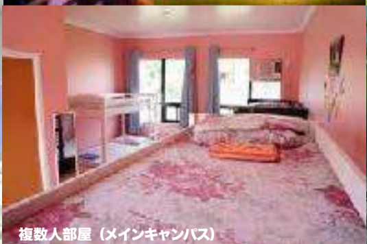
複数人部屋 (メインキャンパス)