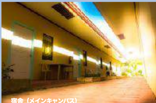
宿舎 (メインキャンパス)