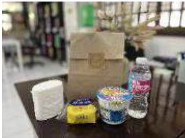
到着時の無料ウェルカムセット