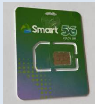
校内売店で販売の SIMカードは約100円

メール送受信はもちろん 動画視聴に加え Zoomミーティング も問題無し。校内 WIFIであれば これら全てが無料。 お仕事・副業も安心！