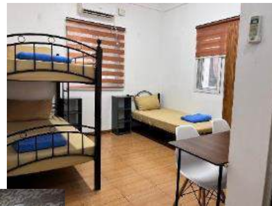
▲3人部屋 ※大きめのベッド1つ+シングル ベッド1つの2種類から選択可