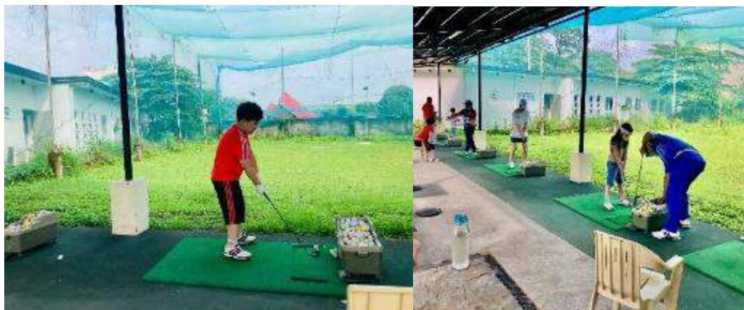
WE ACADEMYキャンパス内のゴルフ練習場