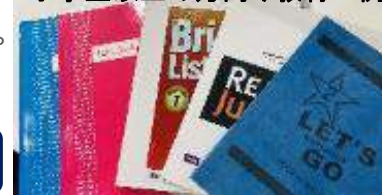
小学生以上の方向け教材一例

当校の親子留学における最大の特徴は、4歳～小学校未就学児の方には毎日のカリキュラムが組まれた幼稚園を自前で保有していることです。同幼稚園では科目ごとに教材・ツールもご用意しており、万一生徒が1人となっても、最低講師とスタッフが計2名以上ついていきますので安心です。小学校～中学3年生のお子様は、講義棟でジュニアの指導経験が豊富なフィリピン人『JUNIOR ESL COURSE』か、欧米ネイティブ講師のマンツーマン授業2コマを含む『JUNIOR ESL NATIVE COURSE』何れかのコースで学んで頂きます。勿論、教材は幼稚園用・小学生以上用(中学卒業まで)に分かれており、それぞれ豊富にご用意しております。