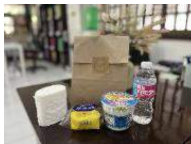
到着時の無料ウェルカムセット