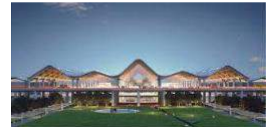
クラーク新国際空港