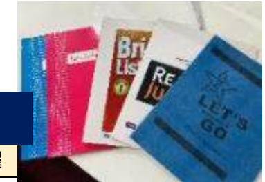
小学生以上の方向け教材一例

当校の親子留学における最大の特徴は、4歳～小学校未就学児の方には毎日のカリキュラムが組まれた幼稚園を自前で保有していることです。同幼稚園では科目ごとに教材・ツールもご用意しており、万一生徒が1人となっても、最低講師とスタッフが計2名以上ついていきますので安心です。小学校～中学3年生のお子様は、講義棟でジュニアの指導経験が豊富なフィリピン人『JUNIOR ESL COURSE』か、欧米ネイティブ講師のマンツーマン授業2コマを含む『JUNIOR ESL NATIVE COURSE』何れかのコースで学んで頂きます。勿論、教材は幼稚園用・小学生以上用(中学卒業まで)に分かれており、それぞれ豊富にご用意しております。