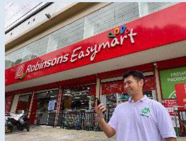
学校から徒歩3分の大型スーパー前にて

学校から車で10分の NEPOモールにて プリペイドロードカード を購入可能。プランは 多々あり、500ペソで 約50GB＝動画を約 80時間視聴可能 (有効期間1ヶ月)。