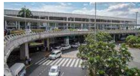
マニラ国際空港（ターミナル2）

コロナ前までもクラーク←→マニラ北部間は高速道路が開通していたものの、マニラの中心部にあるマニラ国際空港から高速道路間の渋滞がひどく、マニラ←→クラーク間は2時間～、渋滞状況によっては4時間かかっていました。その後、2020年に『SKYWAY』という高速道路がマニラ国際空港近くからクラーク間全面開通したことで、 現在は安定してマニラ空港⇄クラーク間の移動は片道約2時間（最速1時間40分）で可能となっています。